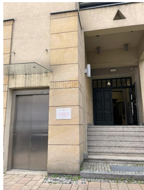
Wejście na Scenę w Malarni