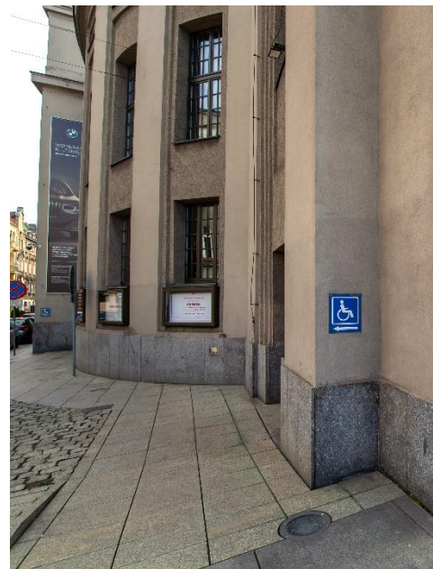
Wejście dla osób na wózkach

Po chwili przyjdzie pracownik obsługi i pomoże Ci.