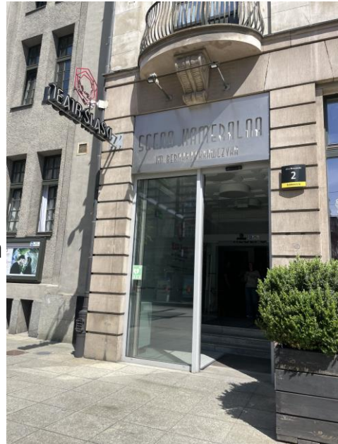
Wejście na Scenę Kameralną

Toalety dla osób z niepełnosprawnościami są też przy Scenie Kameralnej i Scenie w Malarni.